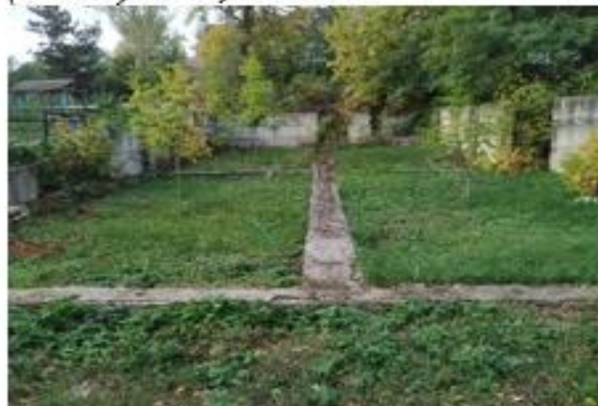
„Construcția școlii primare 240 de locuri s.Bănești” (a.2009)- 1.000,2 mii lei