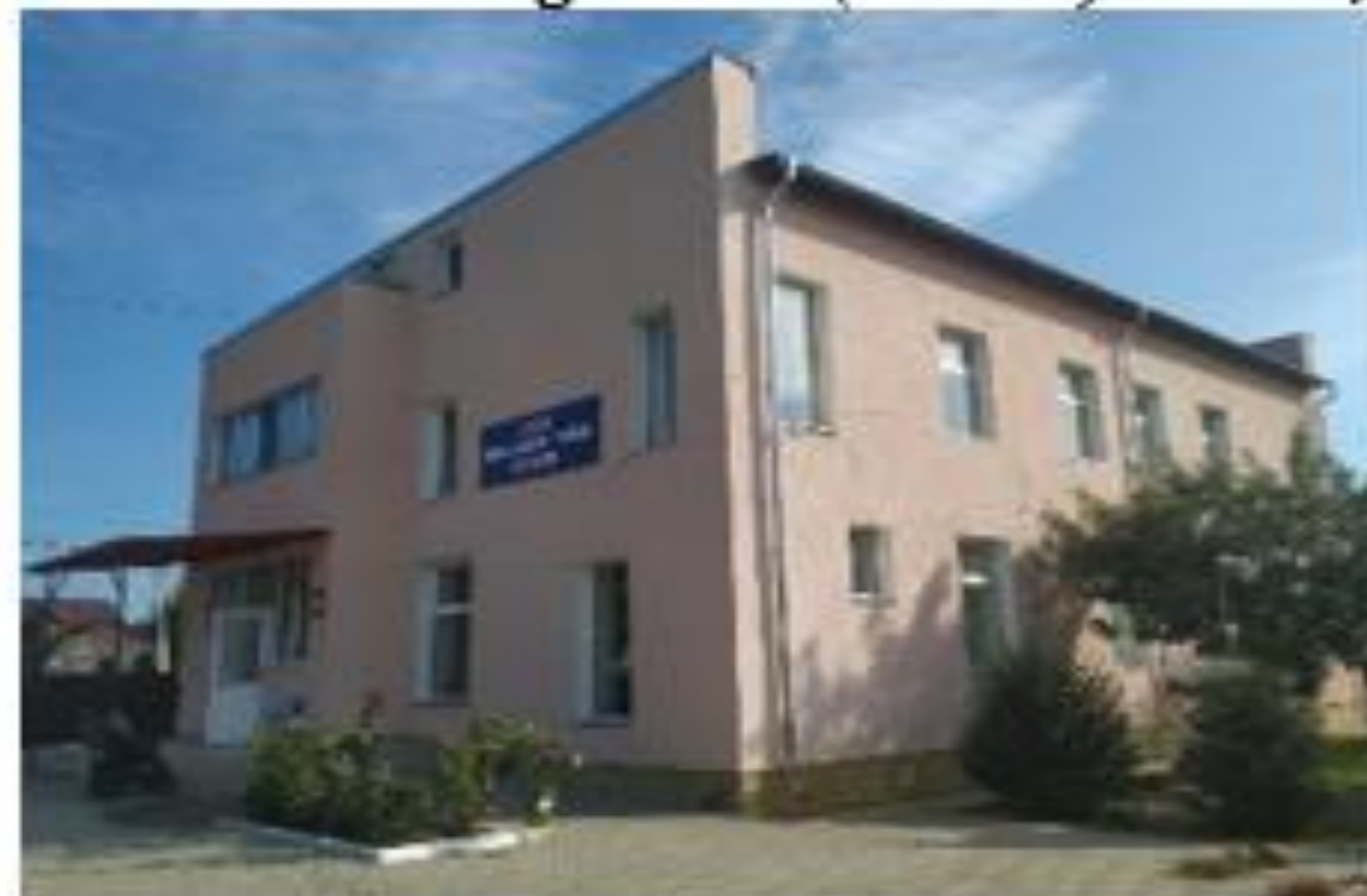
Obiectul „Gazoductul Chișelnița-Ordășei” (a.2006) – 6.896,9 mii lei